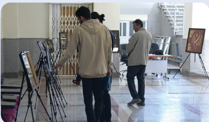
برپایی نمایشگاه محرق در پردیس دانشگاه - 27 آذر 1402