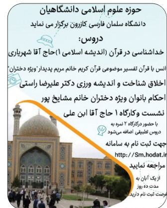
حوزه علوم اسلامی دانشگاهیان پاییز 1402