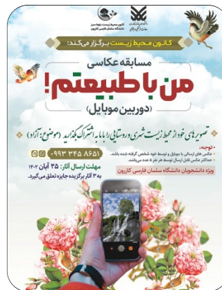
مسابقه عکاسی من با طبیعتم آبان 1402