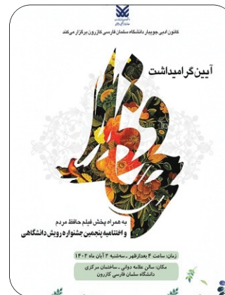
آیین گرامیداشت حافظ و اختتامیه پنجمین جشنواره رویش دانشگاهی آبان 1402