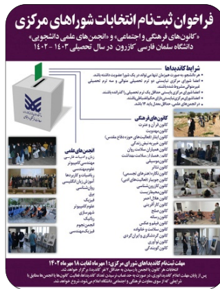
انتخابات شوراهای مرکزی کانون های فرهنگی و انجمن های علمی مهر 1402