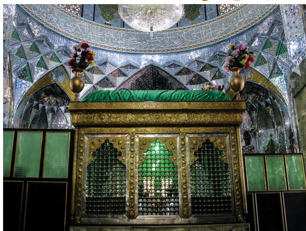
امامزاده سیدحسین کازرون