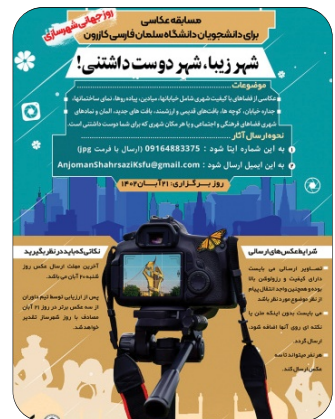
مسابقه عکاسی شهر زیبا، شهر دوست داشتنی آبان 1402