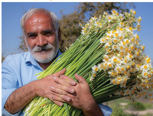
نرگس‌زار منطقه جره و بالاده کازرون