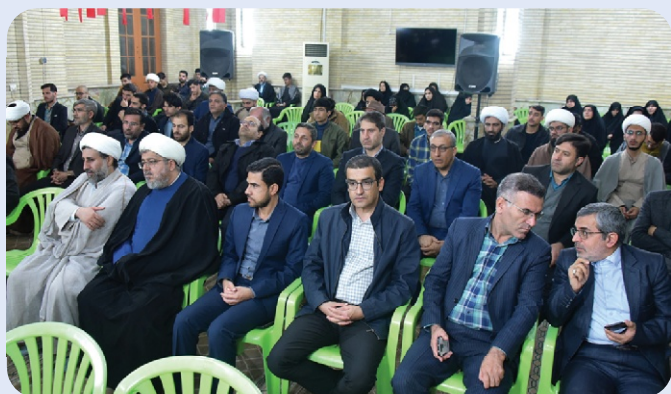
مراسم وحدت حوزه و دانشگاه - 27 آذر 1402