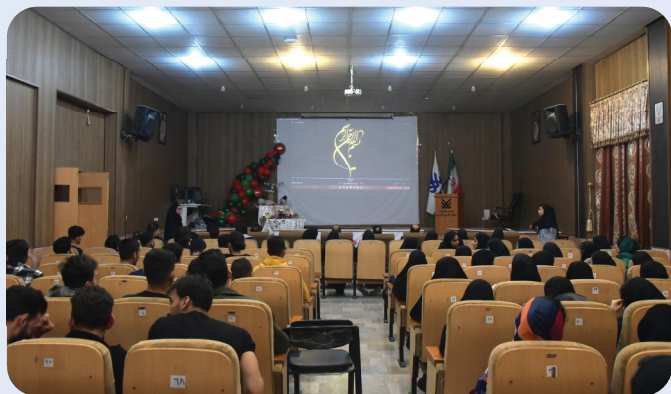
آیین گرامیداشت شب یلدا - آذر 1402