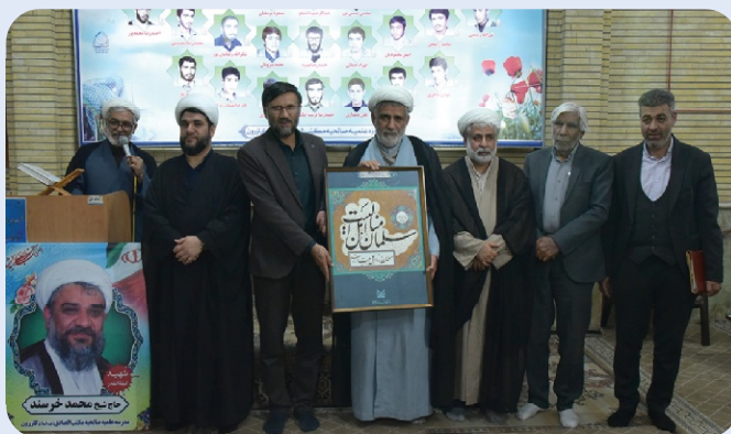
تجلیل از حجت‌الاسلام علی اکبر عارف به عنوان چهره ماندگار وحدت حوزه و دانشگاه - 27 آذر 1402