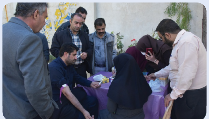
اجرای پوشش ملی سلامت در دانشگاه سلمان فارسی کازرون - 19 آذر 1402