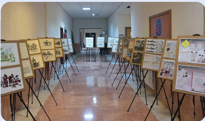
نمایشگاه آثار منتخب دانشجویان دانشگاه در حوزه شهرسازی - 21 آبان 1402