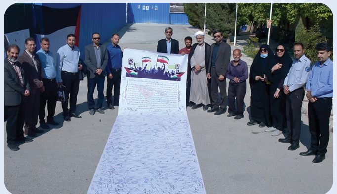
طومار دانشگاهیان کازرون در خصوص گرامیداشت 13 آبان و محکومیت رژیم صهیونیستی - 13 آبان 1402