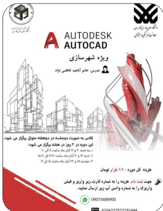
دوره آموزشی اتوکد آبان 1402