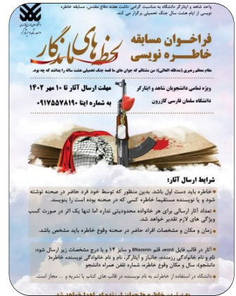
مسابقه خاطر هونوسی لحظه های ماندگار مهر 1402