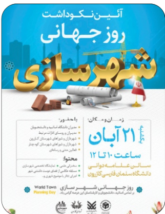
آیین نکوداشت روز جهانی شهر ساز 21 آبان 1402