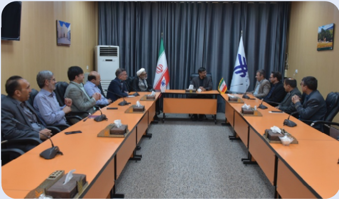
نشست مشترک هیئت رئیسه با رئیس و مدیران دانشگاه پیام نور کازرون - 7 آبان 1402