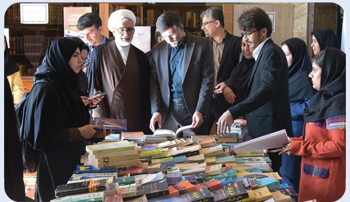
نمایشگاه کتاب دانشگاه سلمان فارسی کازرون - 27 آبان 1402