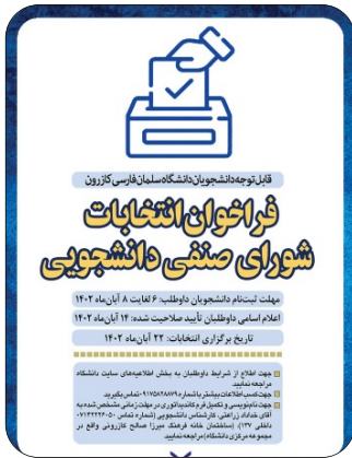
انتخابات شورای صنفی دانشجویی آبان 1402